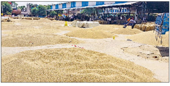
रेवाड़ी। अनाजमंडी में फड़ पर लगी बाजरे की ढेरियां।

हरिभूमि न्यूज ▶▶ रेवाड़ी दो-तीन दिन तक आंशिक बादल छाने के बाद आसमान पूरी तरह साफ होना शुरू हो गया है। मौसम साफ होने के साथ ही दिन का पारा चढ़ने लगा है, जिससे गर्मी दोपहर बाद तक पकमान छुड़ा रही है। रात का तापमान कम रहने के कारण लोग चैन की नोंद सो रहे हैं। मानसून की वापसी की कोई संभावना नहीं है, परंतु सप्ताह के