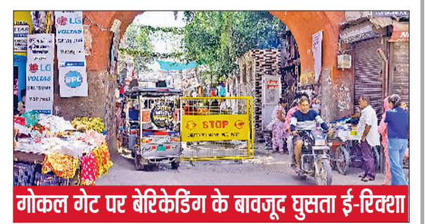
गोकल गेट पर बैरिकेडिंग के बावजूद घुसता ई-रिक्शा

हरिभूमि न्यूज ▶▶ रेवाड़ी रविवार को अतिक्रमण मुक्त करने के लिए नगर परिषद की योजनाएं कई बार फेल हो चुकी हैं। यहां तक कि प्रतिबंध के बावजूद भी धरल्ले से सड़ें बाजार लगाया जा रहा है। बंद दुकानों के आगे फड़ी लगाकर सामान बेचा जा रहा है। इसके अलावा बाजार में सड़क पर लगी रेहड़ियां भी परेशानी बनी हुई है। रेहड़ी वाले एक जगह न खड़े होकर भीड़भाड़ वाली जगह रेहड़ी खड़ी करके व्यवस्था बिगाड़ रहे हैं।