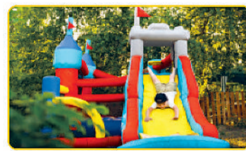
Kids Play Area