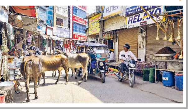
बाजार में दिन में भी लोगों के बीच गोवंश घूम कर परेशानी पैदा कर रहे हैं। शहर के मुख्य मार्गों व बाजार में सड़क पर अवैध पार्किंग में खड़े वाहन अव्यवस्था फैलाने में कसर नहीं छोड़ रहे

हरिभूमि न्यूज ▶▶ रेवाड़ी रविवार को अतिक्रमण मुक्त करने के लिए नगर परिषद की योजनाएं कई बार फेल हो चुकी हैं। यहां तक कि प्रतिबंध के बावजूद भी धरल्ले से सड़ें बाजार लगाया जा रहा है। बंद दुकानों के आगे फड़ी लगाकर सामान बेचा जा रहा है। इसके अलावा बाजार में सड़क पर लगी रेहड़ियां भी परेशानी बनी हुई है। रेहड़ी वाले एक जगह न खड़े होकर भीड़भाड़ वाली जगह रेहड़ी खड़ी करके व्यवस्था बिगाड़ रहे हैं।