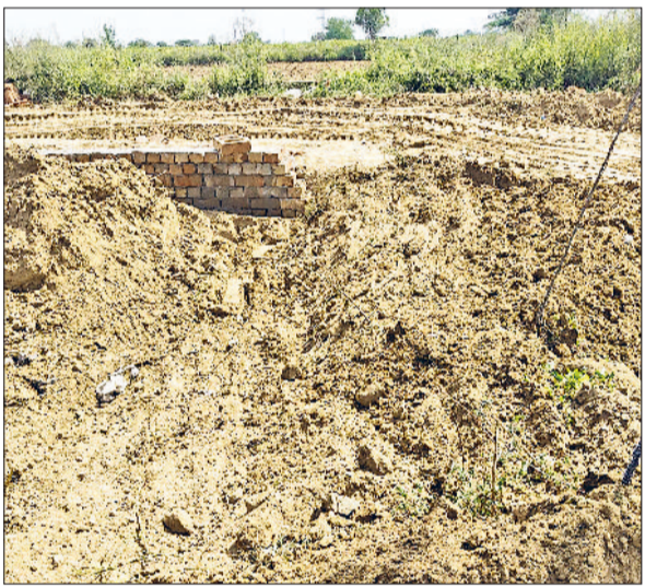
रेवाड़ी। भाकली गांव में बनवाया जा रहा पक्का रास्ता।